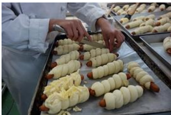
ウィンナーロール