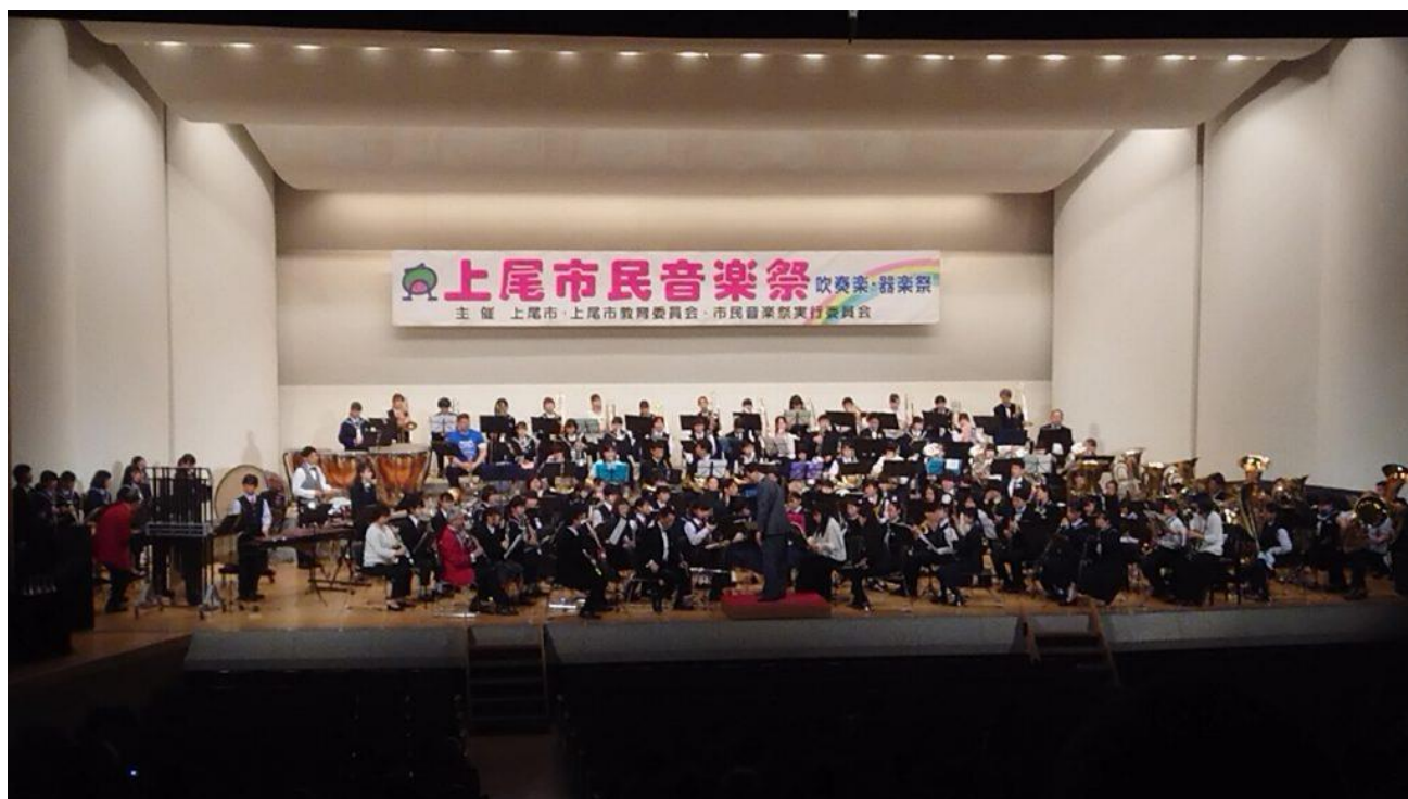
△ 全体合同演奏の様子